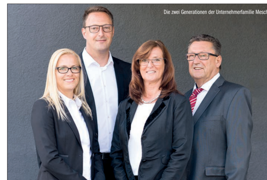
Die zwei Generationen der Unternehmerfamilie Mesch

Weitere Informationen unter: S+M GmbH Tel. +49 (0) 2431 9654-0 info@sm-gmbh.de www.sm-gmbh.de