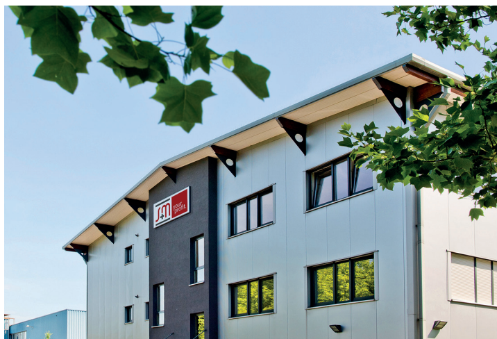
Die S+M GmbH mit Sitz in Erkelenz.

Die aktuelle Situation lässt verständlicherweise einige Operator vor Investitionen zurückschrecken und eine eher abwartende Haltung einnehmen. Dabei spricht vieles dafür, dass gerade jetzt ein günstiger Zeitpunkt ist, bei der Telemetrie und damit Digitalisierung auf die wirtschaftlich attraktive Art per Finanzierung zu setzen. Bitte beachten Sie allerdings, dass dieses Angebot zeitlich nur auf das ak-