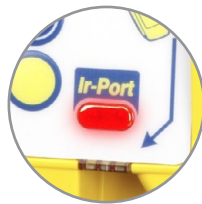
Infrarot-Abrechnungssystem nach EVA/DTS-Standard