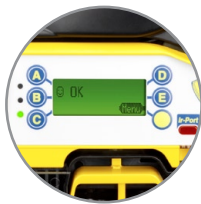
Benutzerfreundliches Display mit intuitivem Menüsystem inkl. LED-Diagnostik